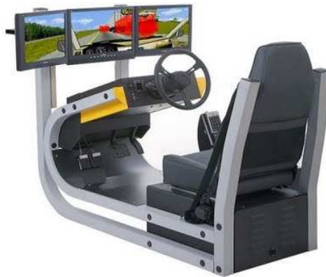
Imagen 3. Ejemplo de un simulador para la conducción de automóviles.