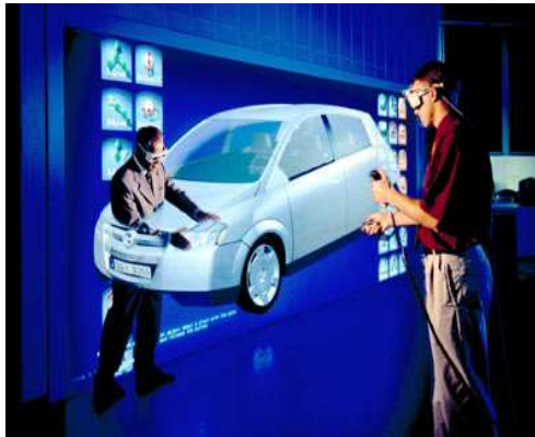
Imagen 7. Ejemplo de una reparación de un vehículo en un entorno virtual. http://www.autovia.com