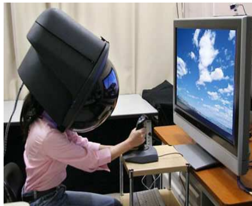
Imagen 4. Dispositivos necesarios para la Realidad Virtual; modo "inmersivo".