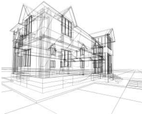
Imagen 2. Ejemplo de Realidad Virtual “ no inmersiva ”. Diseño de obra de arquitectura.

http://emprendimientosocialdelasentidades.blogspot.com/2009/04/emprendimiento-en-entidades-publicas.html