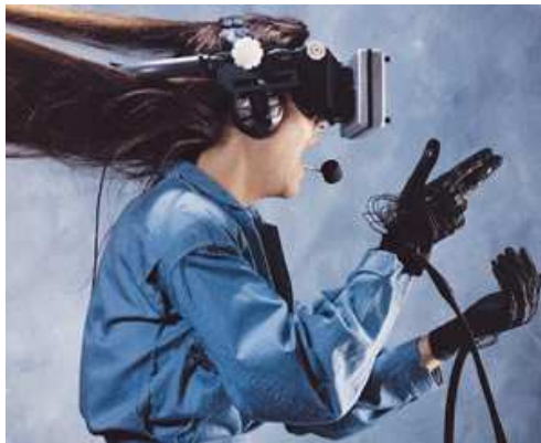
Imagen 1. Ejemplo de Realidad Virtual “ inmersiva ”.

http://emprendimientosocialdelasentidades.blogspot.com/2009/04/emprendimiento-en-entidades-publicas.html